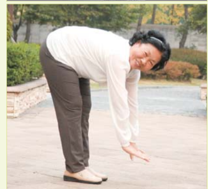
Na het gebed, werd ze genezen van de L4 en L5 hernia die haar zenuwen knelden