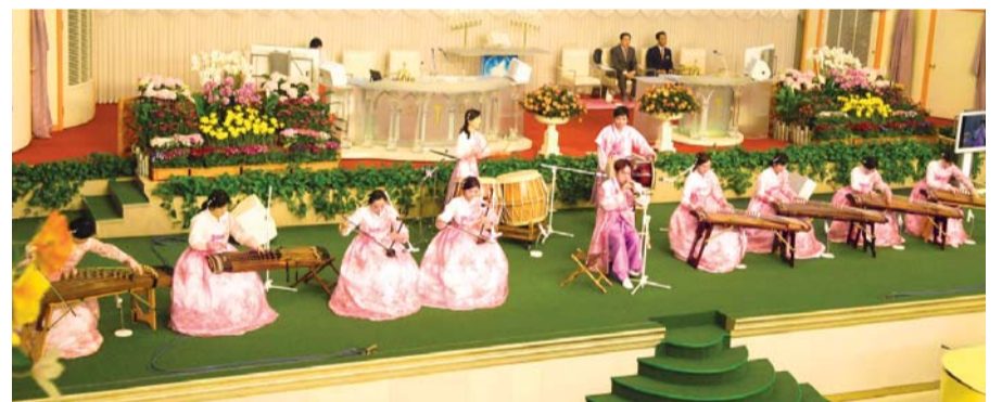
Serem Koreaanse Traditionele Muziek Team brengt een speciaal optreden

Ik geef alle dank aan God, die mij deze grote zegen heeft gegeven en die mij ook redde van de weg van de dood en mij de hoop voor het Nieuwe Jeruzalem gaf. Halleluja!