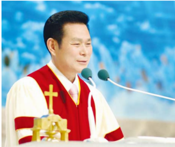
Vanempastor dr Jaerock Lee

Hiljem pani kuningas Saul Taaveti sõjaväe juhiks. Aga see õhutas Saulis armukadedust ja kadedust.