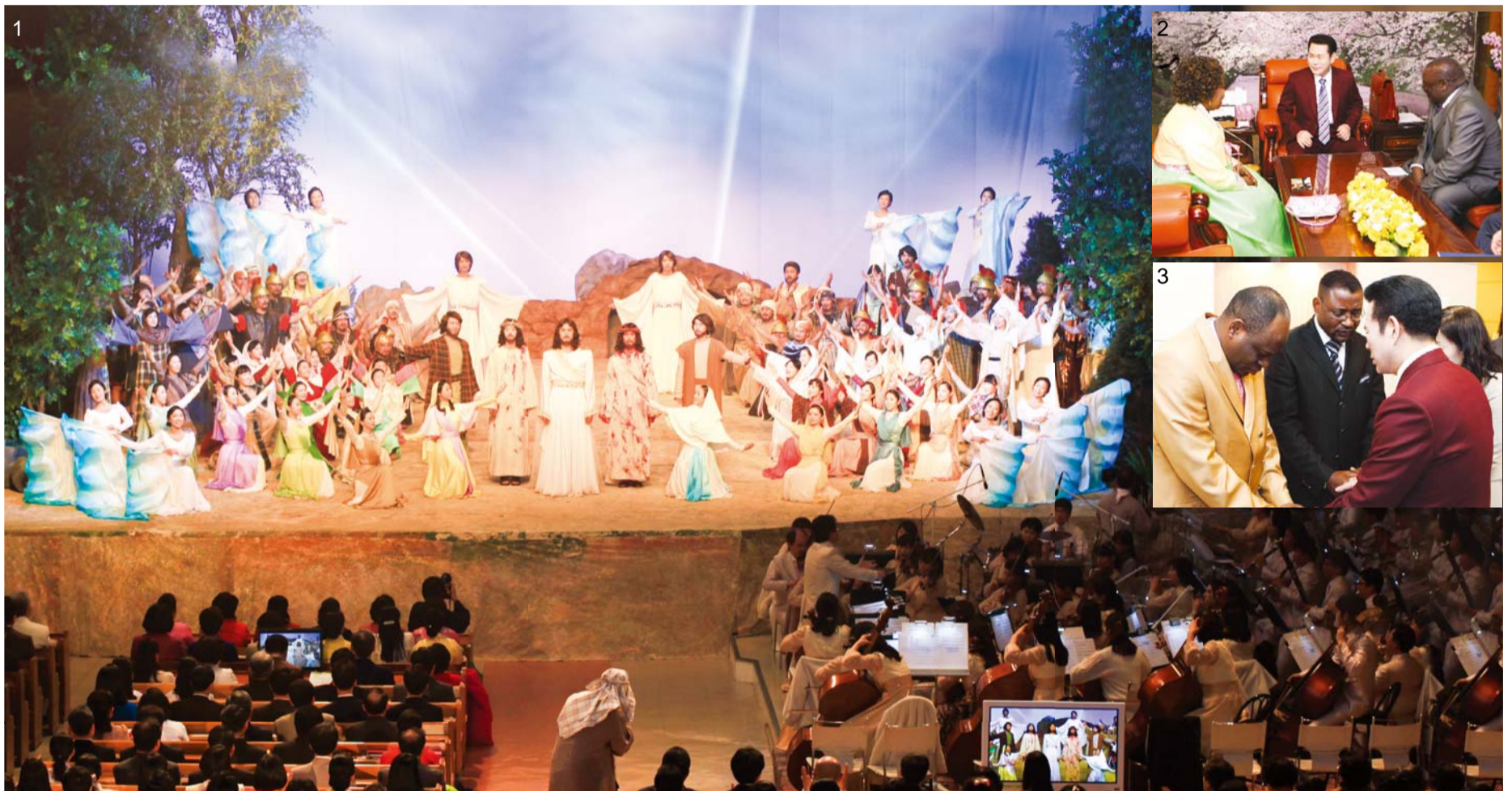
Ühe kolmest tähtsaimast kristliku pühast – ülestõusmispühade pühapäeva – tähistamine. Manmini Kesk koguduses oli ülestõusmispühade pühapäeva teenistus ja leivamurdmise osadus (fotod 1). Koguduseliikmed tänasid ja austasid Isandat koos välismaa pastorite ja usklikega, kes tulid ja jagasid igavese elu ja ülestõusmise lootuse rõõmu (fotod 2, 3).

Mida sügavamalt koguduseliikmed Isandat armastavad, seda suuremat rõõmu ja tänu nad tunnevad. 31. märtsil, 2013. aastal oldi ülestõusmispühade pühapäevahommikul teenistusel leivamurdmise osaduses. Teenistusel osalesid GCN TV ( www.gcntv.org ) kaudu umbes 10000 haru- ja liitkoguduse liikmed, mis muutis ülestõusmispühad veelgi tähenduslikumaks.