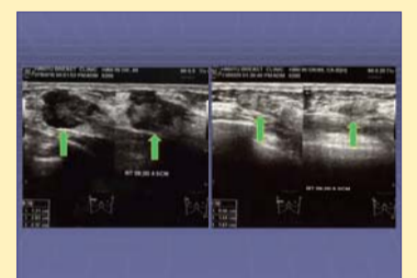
Ultrasonograafia – 2,17 cm suurune homogeneenne sõlm kadus