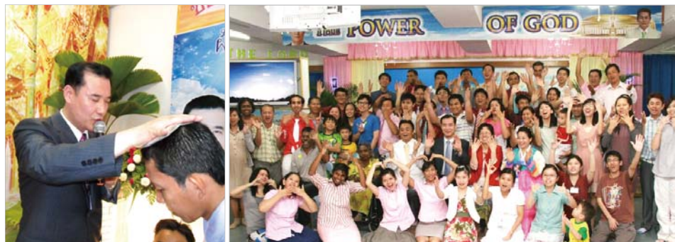
Ta palvetas palverätikuga Tai koguduseliikme eest (Apostlite teod 19:11-12). Ta rõõmustas Penangi Manmini Kurtide Koguduse aastapäeva pidustustel Malaisias.

Ma olen neil päevil väga õnnelik, sest paljud koguduseliikmed uuenesid, kui ma edastasin neile Püha Vaimu juhatusel Jumala, Isanda ja karjase armastust. Täna Sind, Jumal, et Sa õnnistasid mind ja tegid minust tõelise pastori. Ma tänan ja austan kõige eest Jumalat!