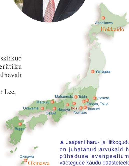
▲ Jaapani haru- ja liitkogudused on juhatanud arvukaid hingi pühaduse evangeeliumi ja väetegude kaudu päästetele