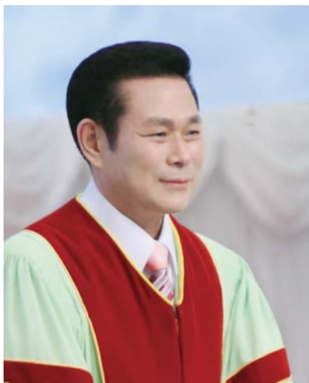
Vanempastor dr Jaerock Lee

„Aga Vaimu vili on armastus, rõõm, rahu, pikk meel, lahkus, headus, ustavus, tasadus, enesevalitsus – millegi niisuguse vastu ei ole Seadus“ (Galaatlastele 5:22-23).