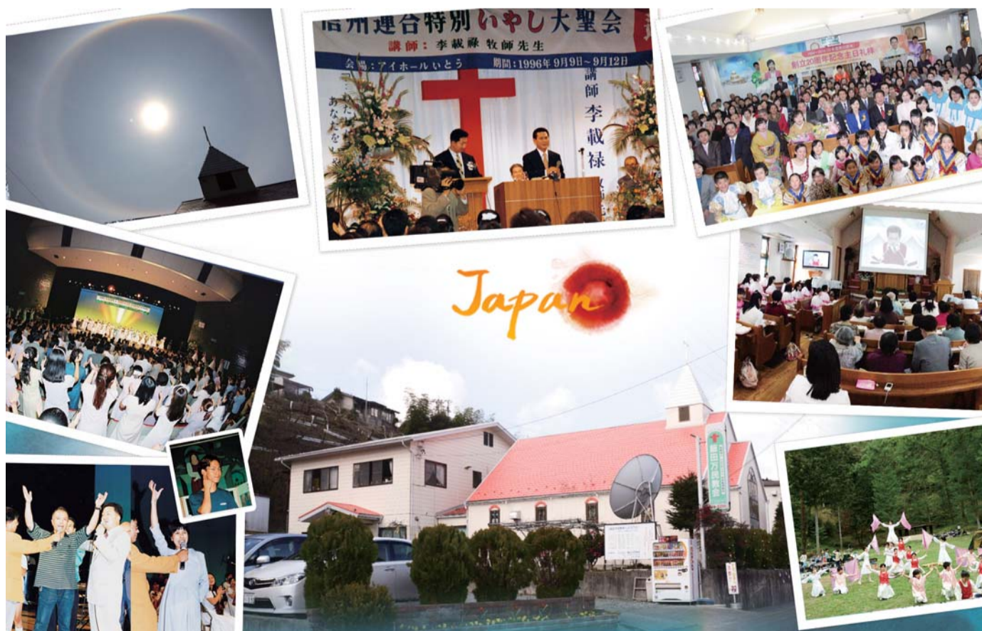
▲ Keskel: Iida Manmini kogudus, kellaosuti suunas vasakult; Nagoya tervenduskoosolekusarja tunnistuste andjad; Iida Manmini koguduse kohal taevas olev ümar vikerkaar; Shinshu ühendkoosolekusari; Iida Manmini koguduse aastapäevateenistus; GCN-i vahendatud ülistusteenistus ja koguduse õpilased vabaõhuteenistustel tunnistust andmas

Kui ma vabanesin isekatest motiividest ja kõrkusest, hakkasid Jaapani pastorid ühinema. Ma lootan, et me teenime Manmini ülemaailmse kihelkonna alusena. Ma toon kõige eest tänu ja au Jumalale, kes oli minuga kannatlik ja ootas, kuni ma uuenesin.