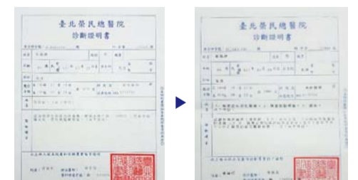
Ennen rukousta diagnosoitu dementia (vasen), rukouksen jälkeen ei dementian oireita, CDR-pisteet 1 (oikea)

20. syyskuuta hänellä oli toinen tarkastus, ja se osoitti, että hän oli täysin normaali. Annan kaiken kiitoksen ja kunnian Jumalalle, joka antoi meidän kokea tämän hämmästyttävän voiman. Kiitän vanhempaa pastoria, joka rukoili meidän puolestamme.