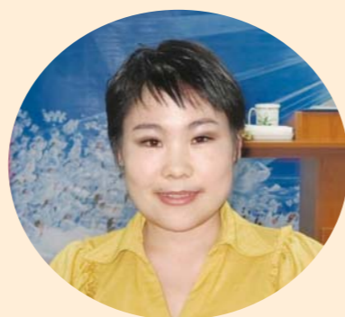
Эзний хайрыг дамжуулдаг ажилтан болохыг маш ихэд хүсч байна.

Илүү талархалтай зүйл нь миний үс бүр урьдныхаасаа илүү өнгөлөг бөх бат болсон ба салаалдаггүй болсон юм. Ингэж Бурханы агуу хүч чадлыг дахин нэг удаа мэдэрсэн бөгөөд үргэлж талархал дотор баяр хөөртэйгөөр амьдарч байна. Амьдралын жинхэнэ утга учрыг мэдэхгүй төөрөлдөж яваа үй олон хүмүүст