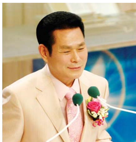
Доктор И Жаерок Тэргүүн Пастор

Бурханы жинхэнэ үр хүүхэдтэй болохын тулд төлөвлөсөн төлөвлөгөөний дунд хамгийн чухал хэсэг болох Есүс махан биеэр энэ газар дээр ирээд төрөл бүрийн зовлон болон загалмайд цовлогдон хүн төрөлхтөнийг аврах авралын замыг төгс нээж өгсөн юм. Энэ удаад эдгээрийн лундаас Есүс ташуурдуулан цусаа урсгасан нь ямар учиртай болохыг авч үзэцгээ!