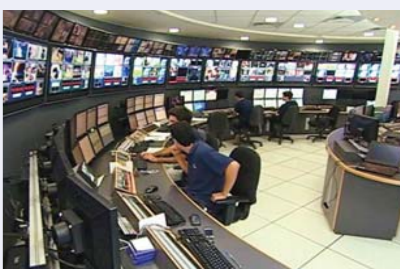
33 Телевизийн төвүүдтэй холбогдон нийт дэлхийн 220 орнуудад ГХХС-гээр (Глобал Харилцаа Холбооны Сүлжээгээр) цацагдан түгээгдэв.