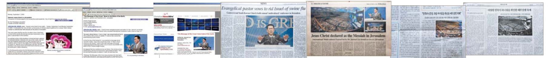
2009 оны Олон Улсын Үндэсний Наадам нь Реутерс болон АФП х гэх мэт хэвлэл мэдээллийнхээр дэлхий дахинаа цацагдсан нь