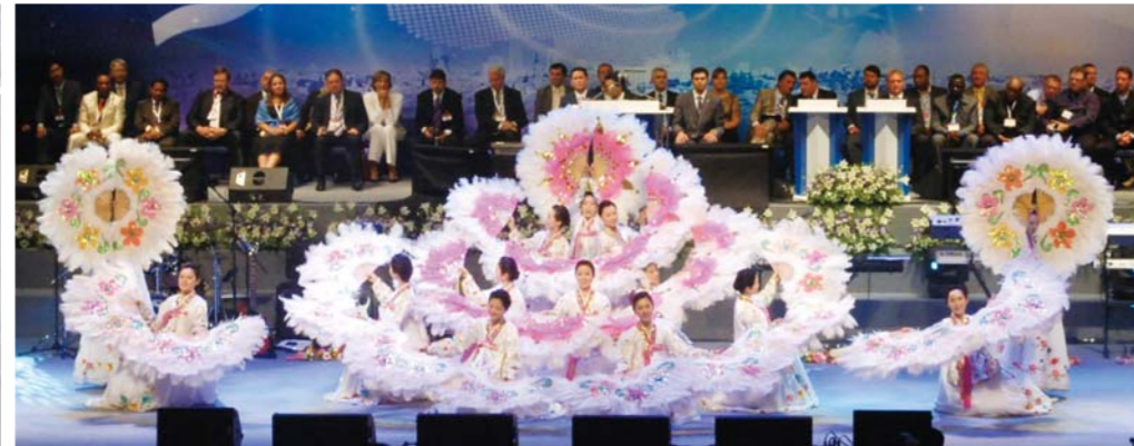
‘Алтан Иерусалим’ хэмээх дуунд нийцүүлэн сэвүүрт бүжиг хийж байгаа нь