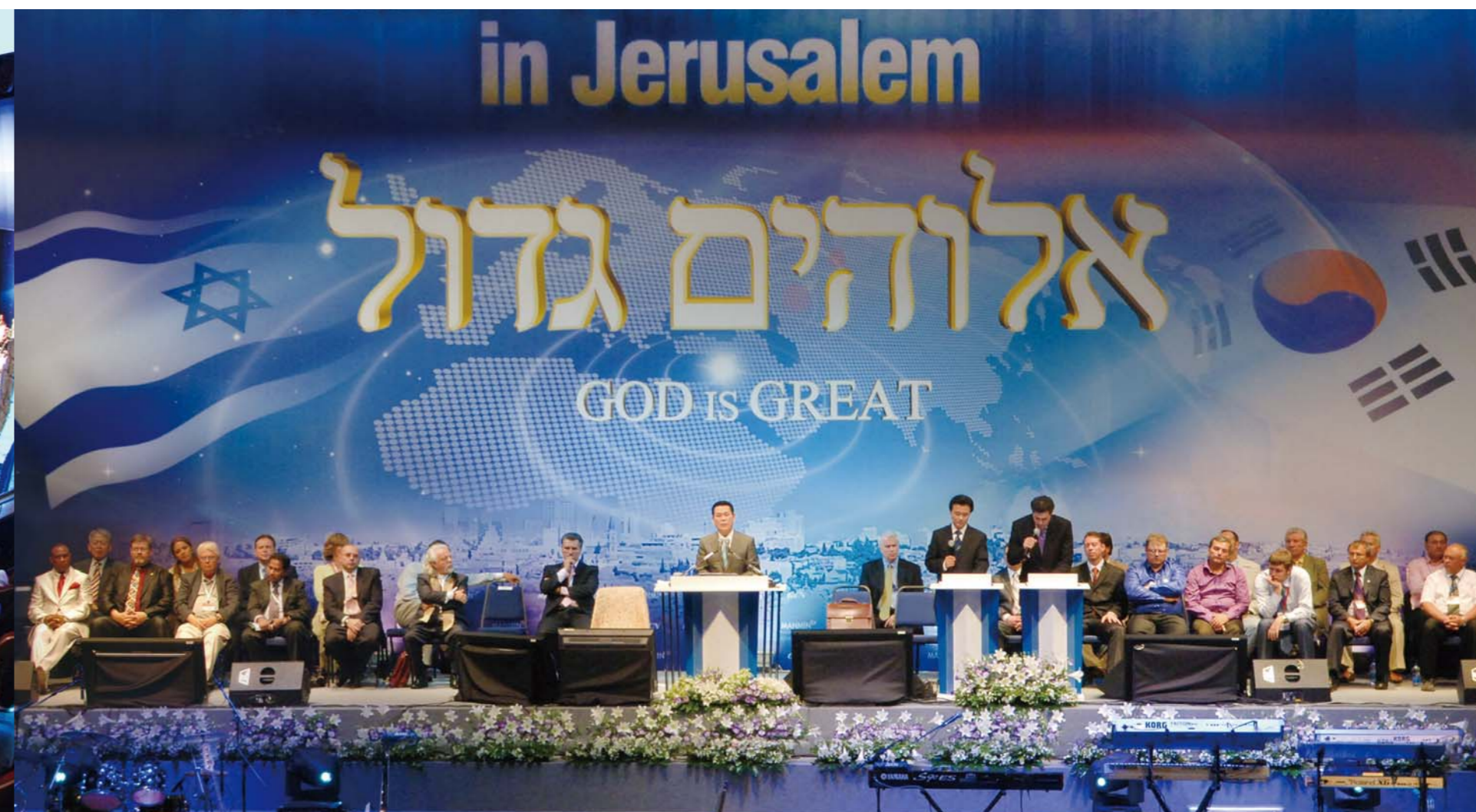
Доктор И Жэй руг гуай тус наадамд хүрэлцэн ирсэн дэлхийн олон орны Христэд итгэгчид Оросын Холбооны Улсаас ирсэн хүндэт зочидод нэрт хандан Есүс Христ бидний Аврагч Мессиа хэмээх сургаалаа тунхаглан айлдав. Сургаал номлол нь Англи хэл рүү орчуулагдсан ба индэр дээр шууд Орос хэл рүү хөрвүүлэгдсэн ба хүрэлцэн ирсэгсд Еврей, Франц, Испани, Хятад болон Япон хэлүүдээр орчуулагдаж байв.