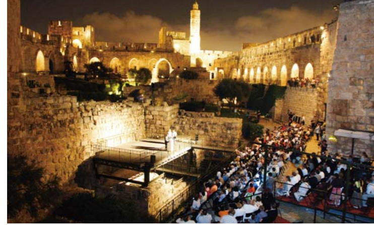
Доктор И Жэй руг нь хүндэт захирлаар томилогдсон “Родно Израиль” хэмээх Израиль дахь анхны Христийн хэвлэл мэдээллийн төвийн нээлтийн үйл ажиллагаа