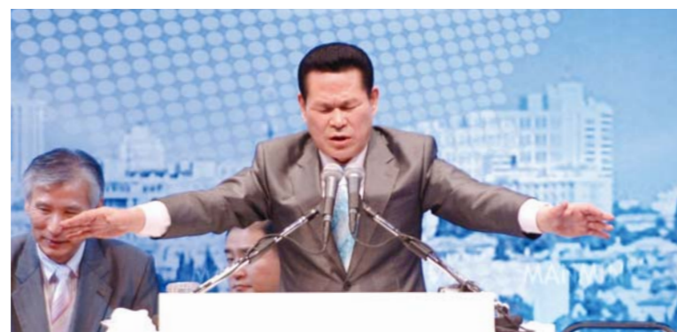
Доктор И Жэй руг наадамд хурал цугларгагсдад хандан эдгэрлийн адислалаа хайрласан ба тус үйл ажиллагааг дэлгэцээр үзэн суугаа үзэгч олонд хандан залбирал үйлдэв.

Франк Бригт доктор АДХНМХ ерөнхийлөгч (АНУ дахь Дэлхийн Христийнхний Нэвтрүүлэг Мэдээллийн Холбоо) GSN-ны ерөнхийлөгч Нестор Коломбо, Сүнс Гэгээрийн Гадаад дахь Нийгэмлэгийн ерөнхийлөгч Михиал Могуйлис, Америкийн МУС-ны (Мэдээлэл үйлчилгээний Сүлжээ) төлөөлөгч Дэн Воддинг, Евроазийн бүсийн НИС-ийн дарга Пабло Баскуэз, Holy God ТВ-ийн захирал Герард Утаякумар ба бусад хүмүүс тус цуглаанг эхлэхийг тэсч ядан хүлээжээ. 6:30-д тус наадмыг Кристал Форумын Ерөнхий Манажер Пастор Олег Хазин нээн үг хэлж түүний дараа Иерусалим хотын засгийн газрын Аялал Жуулчлал Гадаад Харилцааны Сайд Хилик Бар цуглааны талаар баяр хүргэн хүрэлцэн ирсэгсдэд үг хэлэв. Израилийн Аялал Жуулчлалын Хорооны Ерөнхий Захирал Ноаз Бар Нирийн, "Энэ сайхан цаг мөчид хурал цугларсан Иерусалимын амгалан тайван байдлын төлөө залбирал үйлдэн сургаал айлдахаар ирсэн Доктор И Жэй руг гүеэ талархаж байна." гэж хэлсэн нь үнэхээр гайхалтай байв.