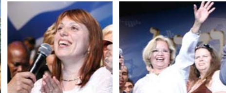
30 настай Таяа алхаж чадахгүй тахир дутуу байсан ч ангижирсан ба 53 настай Дагидам мөрийн өвчнөөсөө ангижирсан нь