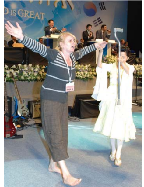
48 настай Медианг таягаа хаян Бурханд талархал өргөж байгаа нь