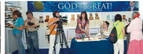
Доктор И Жэй руг гуай 26 төрлийн номууд нь олон хэл дээр орчуулагдан зарагдаж байгаа нь