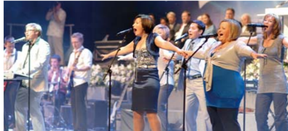
Израилийн магтаал дуу, мөргөлийн баг