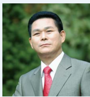
Доктор И Жэй руг

Тэгвэл тэр болзлууд нь юу байсан юм бэ? Анхны бэлэл нь: Аврагч маань хүн байх ёстой Учир нь үхэл нь нэг хүнээр “Адамаас” ирсэн тул үхэгсдийн амилалт нь мөн нэг хүнээр иржээ (1 Коринт 15:21). Тиймээс, Есүс энэ дэлхийд хүний бие махбодниор төрөн мэндэлж хүн төрөлхтөний бүх нүглийг ганц удаагийн золигтоор аврах ариун зорилготой ирэв (Еврей 7:27, 9:12). Хөөр дахь бэлэл нь: Аврагч маань Адамын удамт байх ёсгүй Адамын үр удам бүгд нүгэлт хүмүүс юм. Нүгэлт хүн бусдыг нүглээс нь гэтэлгэж чадахгүй. Мариа Жозефтэй хуримлахаас өмнө Есүс Ариун Сүнсээр төрсөн тул түүнийд уламжлан авсан гэм нүгэлгүй байв. Угтаа Есүс Онгон Марианыг хэвлийг л түрхэн зуур хэрэглэсэн юм. Гурав дахь бэлэл нь: Аврагч маань хүн төрөлхтөнийг аврах хүчтэй байх хэрэгтэй Сүнсэлг ертөнцийн хуулийн Дээрх нийтлэл нь Доктор И Жэй руг ийн наадамын хоёр дахь өдөр (2009 оны 9-р сарын 7-ны) сурган тунхагласан сургаалын хэсгээс авав.