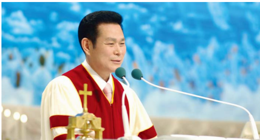
Доктор И Жей руг Тэргүүн Пастор

Хэрэв бид гэрэл дотор үйлдэн, Бурханы үгийн дагуу амьдрах бус зөвхөн амаараа л итгэдэг гээд Бурхан бидэнд авралыг өгөх боломжгүй бөгөөд үүнийг та мэддэг бол мэдээжийн үйлс дагалддаг жинхэнэ итгэлтэй болох хэрэгтэй билээ. Тэгтэл итгэдэг мөртлөө аврал хүртэж чадахгүй хүмүүс нь чухам ямар хүн бэ? гэдэг талаар тайлбарлая.