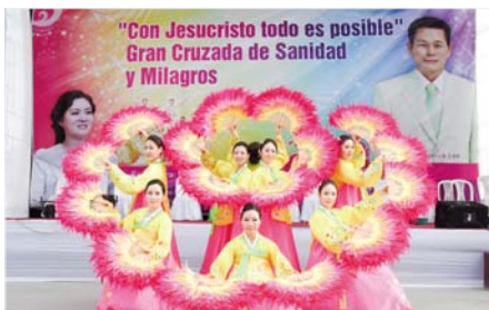
Карабаюу хотод болсон гар алчуурын эдгэрлийн цуглаанд оролцож сэтгэл хөдлөм тоглолт үзүүлж буй “Power worship” багийнхан