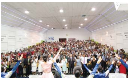
Перу Манмин сүм дээр зохион байгуулагдсан Номлогчдын Семинар ба магтаалийн цаг