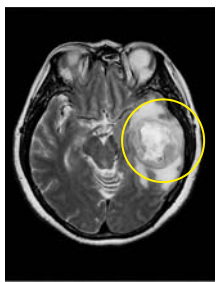
Хагалгааны өмнөх тархины MRI зураг: Хурц хэлбэрийн тархины хорт хавдар

Дараагийн өдөр нь би түргэний тэргээр Хуансун Чeonnam их сургуулийн эмнэлгийн хорт халдвар судлалын төв рүү шилжүүлэгдэн олон төрлийн шинжилгээ үргэлжлүүлэн хийлгэв. Тэр үеийг эргэн бодоход хамаг бие хүйт даах шиг болдог юм. Учир нь цаг хугацаа нэлээд алдсан нь мэдээж бөгөөд миний өвчний онош нь хурц хэлбэрийн тархины хорт хавдрын эцсийн үе шатандаа орсон тул маш яаралтай хагалгаанд орох ёстой гэсэн юм. Хагалгааны дараа ч гэсэн миний амьдрах хугацаа зөвхөн тав зургаан сар гэдгийг хэлэв. Гэр бүлийнхэн минь ч энэ байдлыг мэдээж надаас нуусан байсан юм.