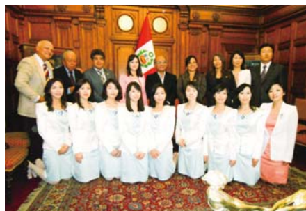
Перу улсын Парламентын ордонд зочилж буй номлолын баг