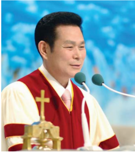
Доктор И Жей руг Тэргүүн Пастор

“Есүс тэдэнд-Үнэнээр, үнэнээр Би та нарт хэлье. Хэрэв та нар Хүний Хүүгийн махыг идэхгүй, цусыг нь уухгүй л бол та нарын дотор амь байхгүй. Миний махыг идэж, цусыг уусан хүн мөнх амьтай бөгөөд Би түүнийг эцсийн өдөрт амилуулна. Учир нь Миний мах бол жинхэнэ хоол, Миний цус бол жинхэнэ ундаа мөн.” (Иохан 6:53-55)