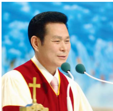
Доктор И Жей руг Тэргүүн Пастор

“Хайр бол тэвчээртэй, энэрэнгүй юм. Хайр агаархдаггүй, бардам зан гаргадаггүй, ихэрхдэггүй” (1 Коринт 13:4).