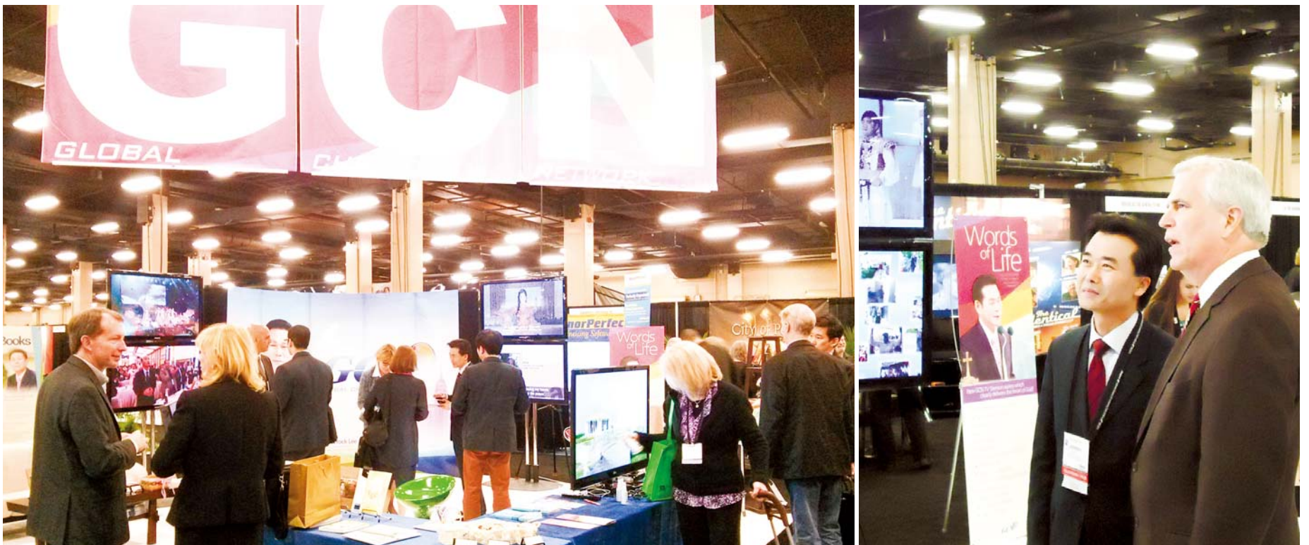
Бүх хүнийг аврахыг хүссэн тэмүүлж буй Бурханы агуу хайрыг харуулсан GCN телевизийн хөтөлбөр. Үзэсгэлэнгийн үеэр GCN телевизийн танилцуулах байранд зочилсон NRB-ийн захирал Франк Врайд (баруун талд).

Дэлхийн 170 оронд Бурханы эрх мэдэлт хүч болон Есүс Христийн хайрыг цацдаг GCN (ЖиСиЭн) телевиз нь Христэд итгэгчид жил бүр цуглардаг дэлхийн хамгийн том уулзалт болох NRB Олон улсын Христчин телевизүүдийн 70 дахь удаагийн үзэсгэлэн яармаг, чуулга уулзалтанд амжилттай оролцлоо. Чуулган 2013 оны 3 сарын 2-5ны хооронд Америкийн нэгдсэн улсын Нашвил (Nashville) хотын Оприланд дах Конвэйншн Төв, Гэйлорд Оприланд зочид буудалд зохион байгуулагдлаа.