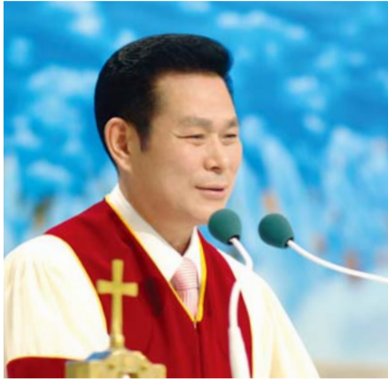
Доктор И Жей руг Тэргүүн Пастор

“[Хайр] зохисгүй авирладаггүй, өөрийнхийг эрдэггүй, уурладаггүй, муутай тооцоо хийдэггүй.” (1 Коринт 13:5)