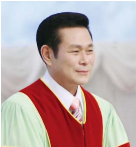
И Жей руг Тэргүүн пастор

“Учир нь мэргэн ухааны ашиг болбоос цалин цагаан мөнгөний ашигаас ч илүү, Орлого нь шижир алтныхаас ч илүү. Энэ нь эрдэнэсээс ч илүү нандин, чиний хүсэх ямар ч зүйл түүнтэй зүйрлэшгүй” (Сургаалт Үгс 3:14-15).