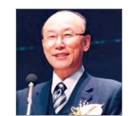
Чо Юнг ги оны шилдэг пастор

Анхны эхнэрээсээ салж 2008 онд үүргээ орхисноос хойш Тодд Бентлеуд сүнс зүгийн багшаар, Өглөөний Од хэмээх сүмийн удирдагчаар ажиллав. Рик Жоунер, болон түүний шинэ эхнэртэйгээ хамт ярилцлага өгөн, өөрийнх нь тухайн асуудал хэрхэн үүдэн гарсан болон Христэд итгэгч залуу үеийнхэнд зориулан түүнээс хэрхэн сэргэмжлэх ярилцлага хийв.