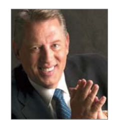
Жон Махвел нь оны шилдэг урамшуулагч

Дэлхийн хамгийн том сүм нь Солонгосын Сеул хотноо байдаг ба пасторуудад зориулсан том хэмжээний семинар зохион байгуулав. Дэлхийн онцог булан бүрээс ирж оролцоогосон өргөн хүрээний сургалт зохиогдов. Уонги Чо гуай өөрийн сүм болон бусад пасторуудад хэрхэн үр дүнтэй эрчимт хүчирхэг сүм бий болгох талаар зааж сургасан байна.