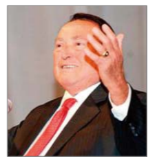
Моррис Серрулло оны шилдэг Евангелист

Шилдэг “Христэд итгэгч” тухай сэдвээр алдаршсан олон зохиолч нарын нэг тэрээр Интернетэд 2009 онд нийгэмийн хувьд үнэлгэв. Одоо тэрбээр Христийн амьдралаар амьдардаг даган мөрдөх мөн чанарыг хуваалцах боломж түүнд олон бий. Түүний номууд нь дэлхийн Христийн дагалдагч болон дагалдагч бус хүмүүст маш их хэмжээний хүч чадал эрмэлзлэлийг өгсөөр байдаг билээ.