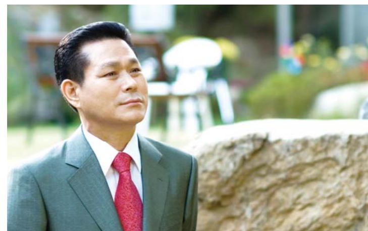
Доктор И Жэй руг

“ЭЗЭН Бурхан тоос шорооноос хүнийг бүтээж, амин амьсгалыг хамраар нь үлээж оруулахад, хүн амьд оршигч болжээ” (Эхлэл 2:7).