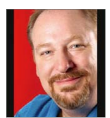
Рик Варен оны шилдэг мэдээлэгч

Христийн Хэвлэл Мэдээ болон Инвиктори байгууллагууд түүнчлэн дэлхийн Христийн олон мянган удирдагч нар болон пасторуудаас хамгийн нөлөө бүхий 10 пастор болон сэргээгч нарыг онцгойлон тодорхойлов. Инвиктори Хэвлэл Мэдээллийн газраас хүлээн авсан зөвшөөрлийн дагуу интернет дээр нийтлэгдсэн өгүүлэлийг гарган тавив. Тус нийтлэлийг доорх хаягаар бүрэн эхээр нь олж уншина уу. http://www.christiantelegraph.com/issue8525.html