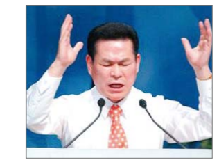
Ий Жэй руг оны шилдэг ТВ номлогч

Дэлхийн даяар нэртэй Сэргээгч Моррис Серрулло хуучин Зөвлөлт Холбоот Улс байсан орноор 2009 онд айлчлав. Энэхүү Христийн пасторууд болон удирдагч наруудтай хийсэн семинаруудын үеэр Евангелийн амжилт ололтуудын тухай хуваалцан уулзагдсан билээ. Моррис Серрулло түүнийг залгамжилж авч яваа ач хүүтэйгээ хүрэлцэн ирэв.