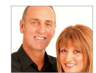
Бриан Хустон оны шилдэг магт дууч

АНУ-ын Алдарт Саддлебак Сүмийн нэгэн пастор 2009 оны мэдээлгээр хамгийн олон удаа гаржээ. Тэрбээр Обаманы сөрөнхийлөгчөөр томилогдох үйл ажиллагаанд индэр дээр төлөөлөх залбирал үйлдэн Америк дахь Христийн үзэл баримтлалыг хүндэтгэн сахиж ажиллав. Түүний нэр нь бусад Христийн удирдагч нараас илүү олонтай хэвлэл мэдээлэл дээр нийтлэгдэж байв.