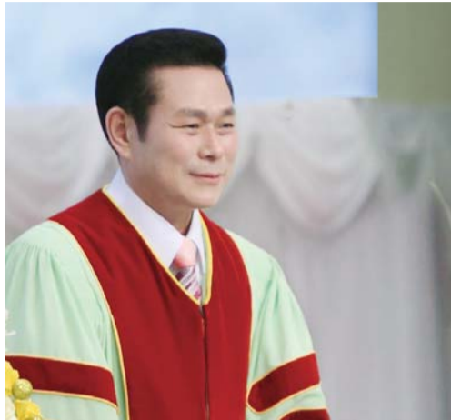
Манмин төв чуулганы тэргүүн пастор, И Жей руг пастор

“Харин дээрээс ирэгч мэргэн ухаан нь нэгд ариун, тэгээд амар тайван, эелдэг, ул суурьтай, өршөөл ба сайн үр жимсээр дүүрэн, ялгаварладаггүй, хоёр нүүр гаргадаггүй аж. Үр жимс нь зөв байгчийн үр нь амар тайвныг бүтээгчдээр амар тайванд таригддаг юм” (Иаков 3:17-18).