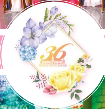
Ойн баярын тоглолт “Цэцэгт замаар найр наадмын өргөөнд”