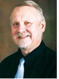
ပါစတာယူရီကာမီကော့၊ အစွဲရေးနိုင်ငံ၊ ဟိုင်ဟာမြို့ရှိသက်စမ်းရေအသင်းတော်