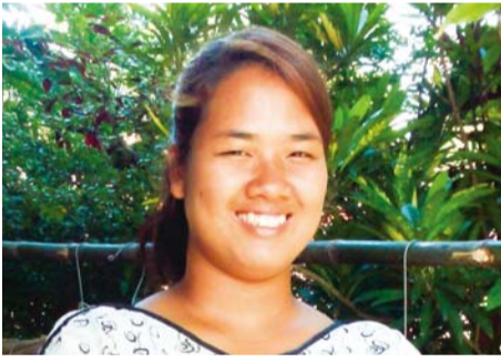
မ စုထာတိတ်လဟန်၊ ချင်ရိုင်းမန်းမင်းအသင်းတော်၊ ထိုင်းနိုင်ငံ

အသိမိတ်ဆွေ မိန်းမတစ်ဦး၏မိတ်ခေါ်မှုဖြင့် ချင်ရိုင်းမန်းမင်းအသင်းတော်သို့ ၂၀၁၁ ခု ဧပြီလ မှ စတင်လျက် ကျွန် မ တ က် ရေ က ခဲ့ သည် ။ ကျွန် မ သည် ဗုဒ္ဓဘာသာဝင်တစ်ဦးဖြစ်သဖြင့် ယေရှုကို သာမန်လူ အဖြစ် မှတ်ယူ ခဲ့ သည်။ တနင်္ဂနွေ ဝတ်ပြုခြင်းအစီအစဉ်၌ ဒေါက်တာဂျေရော့က်လီ က လက်ဝါးကပ် တိုင် သ တ လ်း စ က ဘ ချ သော ခေါ် င်း စ ဉ် ဖြ င် အကြောင်းပြချက်လေးချက်ဖြင့် လူသားအတွက် ယေရှုတစ်ပါးတည်းသာ ကယ်တင် ရှင်ဖြစ်ကြောင်း ဟောပြောခဲ့ သည်။ ထိုနေရာတွင် သခင် ဘုရားကို ကျွန်မလက်ခံခဲ့ပြီး ကျေးဇူးတော် ခံစားခဲ့သည်။