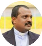
रेम. निशान करे

सन् २००९ मा चेन्नई मानमिन मण्डलीमा जाँदा शक्तिका कार्यहरू देख्न पाएँ। मैले देखेका सबै कुराहरूले मेरो हृदय छोयो र म प्रभावित भएँ। ती कुरा मेरो सेवकाइको निम्ति निकै सहयोगी बनेका छन्। यसै दौरानमा, पहिलो पास्टरहरूको सेमिनार