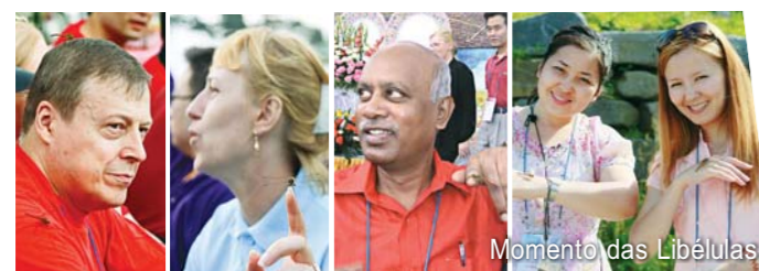
Momento das Libélulas