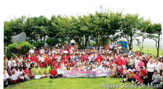
Águas Doces de Muan