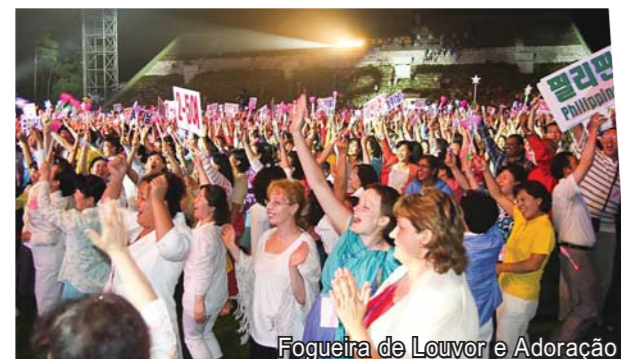
Fogueira de Louvor e Adoração