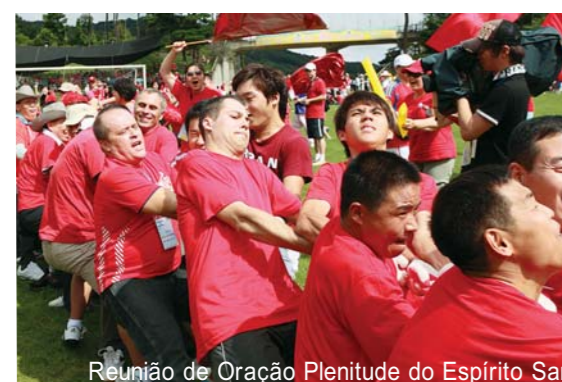
Reunião de Oração Plenitude do Espírito Santo