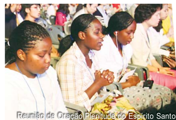
Reunião de Oração Plenitude do Espírito Santo