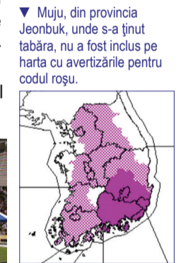
▼ Muju, din provincia Jeonbuk, unde s-a ținut tabăra, nu a fost inclus pe harta cu avertizările pentru codul roșu.