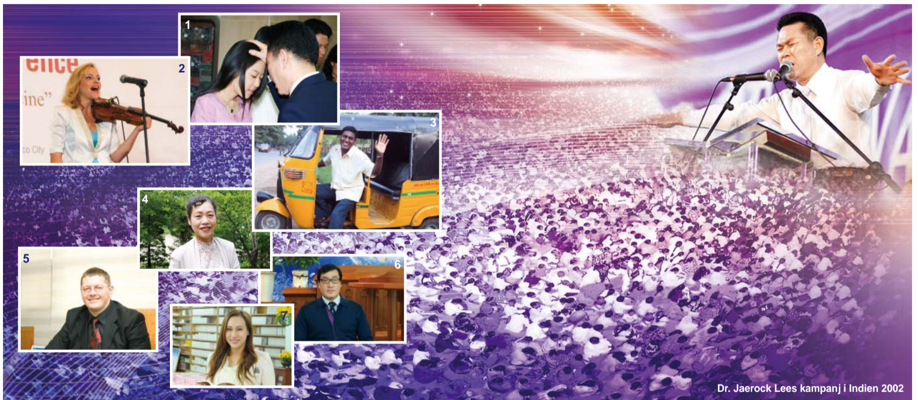
Dr. Jaerock Lees kampanj i Indien 2002

”Det såg ut som om tungor av eld fördelade sig över var och en av dem, och stannade över dem”