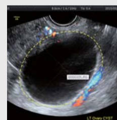
Före bönen: 7,62 cm stor tumör i hennes vänstra äggstock

För att ta emot fullständigt helande offrade jag upp en tredagars fasta. Den 30 juli var jag på en undersökning igen och den visade att klumpen hade försvunnit! Halleluja!