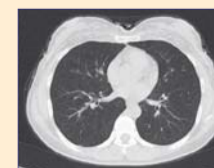
Efter bönen: ingen lungkollaps, normal