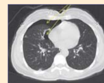
Före bönen: Pneumothorax (lungkollaps) i högra lungan (gul pil)

I januari 2014 gjordes en undersökning igen. Min läkare berättade de goda nyheterna för mig, ”Lungkollapsen har försvunnit. Du har nu en ren och frisk lunga igen.” Halleluja!