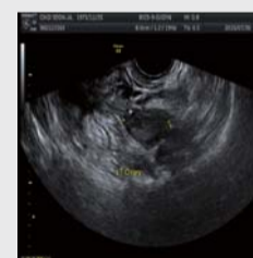
Efter bönen: hennes vänstra äggstock fri från tumören