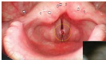
Polyper på högra stämbandet på grund av överansträngning

Två veckor senare kände jag vätska i min hals och sprang till badrummet. När jag spottade ut det var det blod. Jag förväntade mig att det var Guds svar och åkte till sjukhuset. Min läkare sa, ”Det är nästan omöjligt för polyper att spricka av sig själva...” och han tillade att jag hade tur. Polyperna på stämbanden var borta!