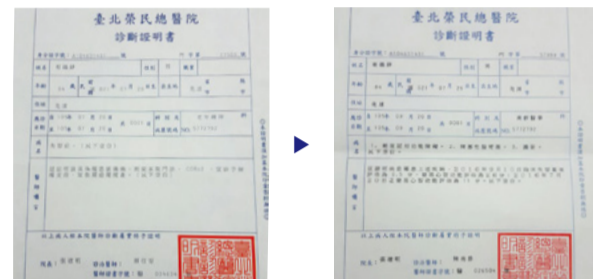
Innan bönen, diagnostiserad med demens (till vänster) Efter bönen, inga symtom på demens med CDR score 1 (till höger)