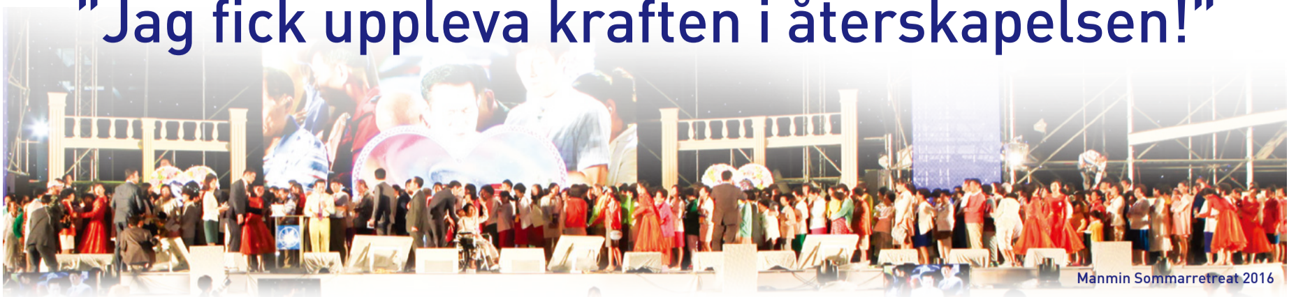
Manmin Sommarretreat 2016

Under Manmin Sommarretreat som hålls varje år i början av augusti har många människor blivit botade från många slags sjukdomar som AIDS, depression, hjärtinfarkt, blödning i hjärnan, demens och blindhet. Låt oss nu höra från de som har vittnat om sitt helande.