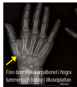
Före bön: Metakarpalbenet i högra tummen och fraktur i tillväxtplattan