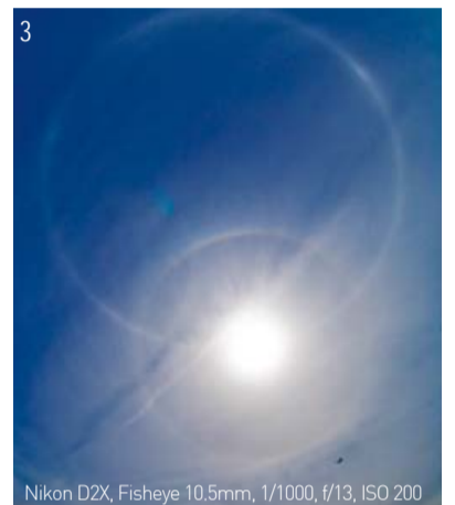
En ringformad regnbåge betyder att löftet är uppnått

I april 2010 förvånades församlingsmedlemmar och boende runt kyrkan över den ringformade regnbågen som syntes över kyrkotornet. En cirkelformad regnbåge passerade genom solen vilket fick solen att likna en sten i ringen och en annan cirkelformad regnbåge omgav solen (Bild 3). Det symboliserade uppfyllandet av Guds omsorgsfulla plan genom evangeliet om helighet som har proklamerats till jordens yttersta gräns och att uppfyllelsen av den plan som Gud har för den sista tiden i världen, inklusive helgedomen Kanaan och den Stora helgedomen. I januari 2011 steg en omfattande regnbåge upp över platsen för Muan sötvatten (Bild 4). Det var en cirkelformad regnbåge runt solen, vingliknande regnbågar som lyste som diamanter på båda sidorna, en halvt cirkelformad regnbåge runt dem, och en regnbåge formad som en fläkt över regnbågarna. Platsen för Muan sötvatten är platsen vid Muan Manmin Church i Jeonnam-provinsen där det salta havsvattnet förvandlades till drickbart sötvatten genom Dr. Jaerock Lees böner precis som det bittra vattnet i Mara förvandlades till sötvatten (2 Mosebok 15:25).