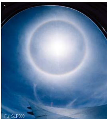
Cirkelformade regnbågar som omger solen och många ovanliga regnbågar

Men regnbågar har fortlopande visat sig över Manmins församlinggrenar likväl som över huvudförsamlingen i och utanför Korea under konferenser och också under många utomhusarrangemang som sommarretreaten och missionsresan sedan den första cirkelformade regnbågen som omgav solen syntes över huvudförsamlingen den 15 maj 1998.