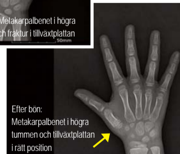
Efter bön: Metakarpalbenet i högra tummen och tillväxtplattan i rätt position