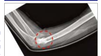
► gumaling ang mga buto, normal ang sukat nito.