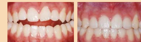
Ooperahan sana siya at magsusuot ng brace sa loob ng 6 – 7 taon dahil hindi maisaayos ang ngipin niya sa anumang paraan. Pagkatapos niyang tumanggap ng panalangin, napantay ang ngipin niya at naayos ito.

May isa pa akong hindi pangkaraniwang patotoo. Nagbago ang hugis ng mukha ko sa pagdalo ko sa ‘Magkakasunod na Dalawang Terminong Espesyal na Pulong Panalangin Daniel’. Dati ang mukha ko ay patulis na parang nakabaliktad na tatsulok. Hindi ito magandang tingnan kapag nakatali ang buhok ko sa likuran. Ngayon ay hugis-itlog na ang mukha ko kaya naitatali ko na ang buhok ko sa likuran. Taos-puso akong nagpapasalamat sa Panginoon na pinayagan ang taong katulad ko na maranasan ang Kanyang dakilang pagkilos kahit binalewala ko ang Salita ng Diyos. Ako ngayon ay mananampalatayang katulad ng trigo.