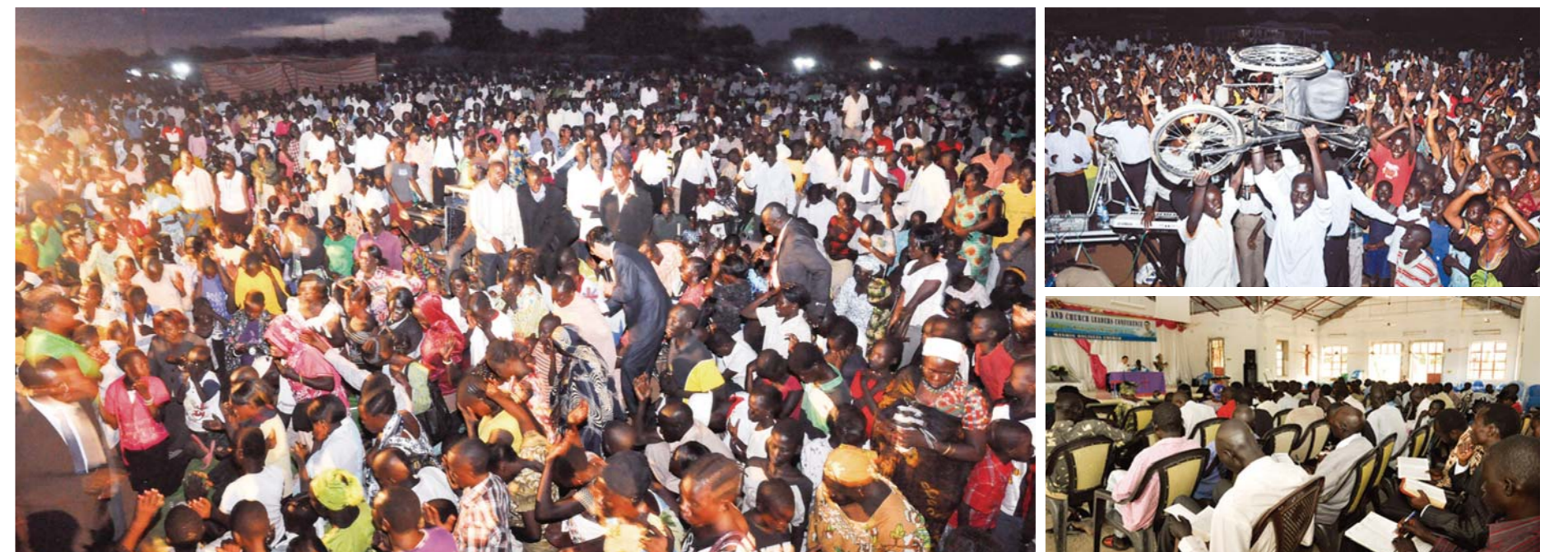
Sa Kumperensya at Krusadang ito, nagpasalamat at niluluwalhati ng mga dumalo ang buhay na Diyos na nagpakita ng maraming mahimalang pagpapagaling at mga tanda.