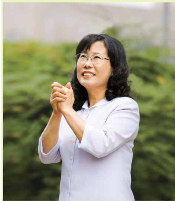
na ang nakaraan. Nahirapan akong huminga at nakaranas ng matinding pananakit ng dibdib, pero kailangan ko pa ring