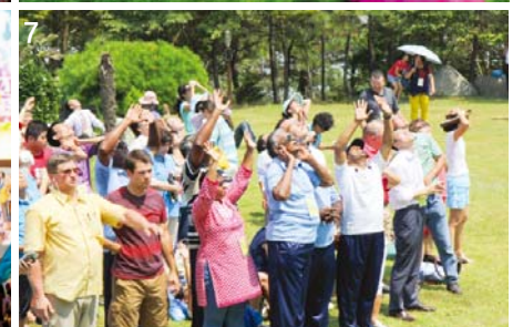
หมายสำคัญและการอัศจรรย์เกิดขึ้นอย่างล้นหลามในค่ายภาคฤดูร้อนของมันมินประจำปี 2013 ศิษยาภิบาลและสมาชิกคริสตจักรจำนวนมากจากต่างประเทศเริ่มมีความเชื่อในระดับสูงขึ้นด้วยการมีประสบการณ์กับฤทธิ์อำนาจของพระวิญญาณและแบ่งปันความทรงจำแห่งความรักอันมีคุณค่ากับสมาชิกในเกาหลี วันที่ 2 วันภาคสนามของมันมิน 2013 (6) วันที่ 3 การนมัสการรอบกองไฟในสวนสนุก โดยยูซันริสอร์ทในเมืองมูจู จังหวัดจอนนัค (1-5) วันที่ 4 บอนาจีตที่เมืองมวน (7)