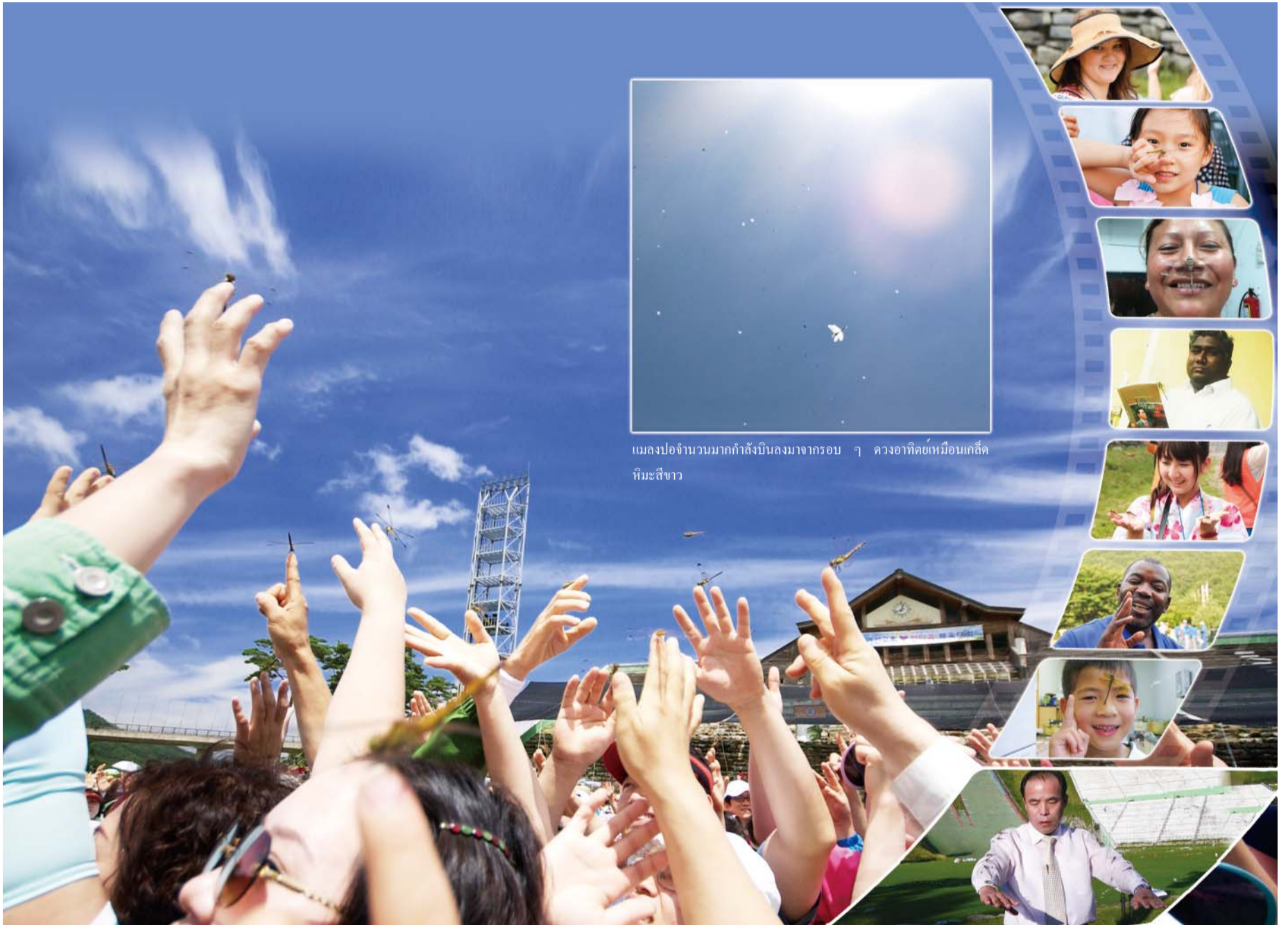
แมลงปอบินจำนวนมากกำลังบินลงมาจากรอบ ๆ ดวงอาทิตย์เหมือนเกล็ดหิมะสีขาว

ในทุกฤดูร้อนสมาชิกมันมินจากทั่วโลกจะสัมผัสกับพระคุณและความรักของพระเจ้าจากการที่เขาได้เห็นฝูงแมลงปอบินที่นำทั้งบินลงมาจากราศวร์ (รูปภาพ:แมลงปอบินเกาะอยู่ตามนิ้วมือของสมาชิกในระหว่างค่ายภาคฤดูร้อนของมันมิน)