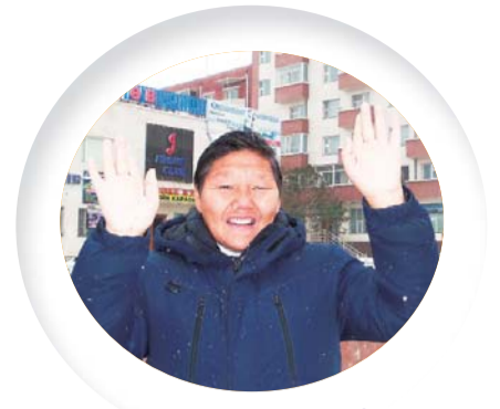
เคอชูเรน (วัย 59 ปี) คริสตจักรแมนมินมองโกเลีย