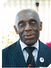
ศ.ดร.ชาร์ลส์ เคลานี ตัวแทนของสมาคมมิชชันนารีทั่วโลก

คำเทศนาแห่งชีวิตทำให้เราซาบซึ้งใจและรู้สึกจิตใจของเราขึ้นมาใหม่ เราได้รับความหวังสำหรับพันธกิจแห่งอนาคต ผมรู้สึกขอบพระคุณและมีความสุขมากที่สามารถเข้าร่วมในการสัมมนานี้ ผมเรียนรู้ถึง