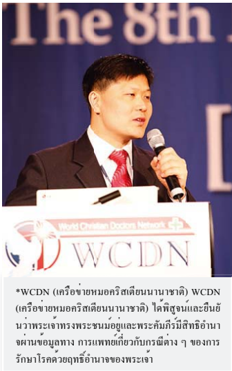
*WCDN (เครือข่ายหมอคริสต์นานาชาติ) WCDN (เครือข่ายหมอคริสต์นานาชาติ) คือที่สุดและอันยิ่งใหญ่ของพระเจ้าทรงพระชนม์อยู่และพระกัมภีร์มีสิทธิอำนาจมาของอูลาง การแพทย์เกี่ยวกับกรณีต่าง ๆ ของการรักษาโรคด้วยฤทธิ์อำนาจของพระเจ้า