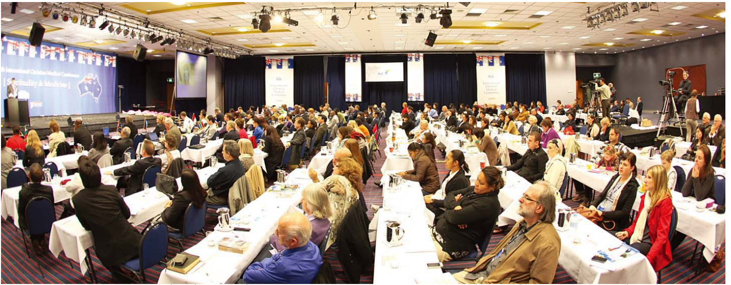
ในการประชุมเครือข่ายหมอคริสเตียนนานาชาติครั้งที่ 8 นี้บรรดาหมอที่เข้าร่วมต่างก็รับฟังการนำเสนอกรณีต่าง ๆ ของการรักษาโรค ของพระเจ้าซึ่งพิสูจน์ให้เห็นถึงฤทธิ์อำนาจของพระองค์ด้วยใจจดจ่อ คนเหล่านั้นถวายเกียรติยศแด่พระเจ้าด้วยเสียงปรบมือที่ดังกึกก้อง หลังจากการนำเสนอและกรณีสิ้นสุดลง (ศูนย์การประชุมและนิทรรศการบริสเบน ประเทศออสเตรเลีย)

การประชุมเครือข่ายหมอคริสเตียนนานาชาติครั้งที่ 8 ถูกจัดขึ้นที่ออสเตรเลียโดยมีหมอจาก 27 ประเทศเข้าร่วม