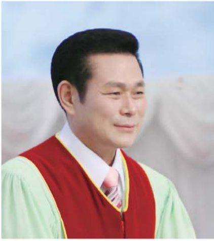
தலைமை போதகர் அறிவர். ஜேராக்கீ

“அவர் தமக்கு முன் வைத்திருந்த சந்தோஷத்தின்பொருட்டு, அவமானத்தை எண்ணாமல், சிலுவையைச் சகித்து, தேவனுடைய சிங்காசனத்தின் வலது பாரிசத்தில் வீற்றிருக்கிறார்” (எபிரெயர் 12:2).