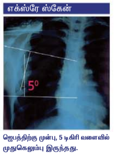
எக்ஸ்ரே ஸ்கேன் ஜெபத்திற்கு முன்பு, 5 டிகிரி வளைவில் முதுகெலும்பு இருந்தது.

நல்ல தேவனை சந்திக்கும்படி என்னை வழிநடத்தி, எனக்கு சுகத்தையும் பதில் களையும் தந்த கர்த்தருக்கே எல்லா நன்றிகளை நான் செலுத்துகிறேன்.