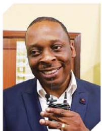
போதகர் தீதே, ஆவிக்குரிய யுத்த கிறிஸ்தவ உழியம், காபோன்.

“உண்மையான போதகரின் இருதயத்தை அறிந்து உணர்ந்தபின் நான் இருதய வியாதியிலிருந்து சுகமானேன்”