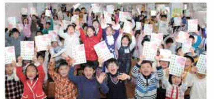
"வேதாகமம் படிக்கும் நேரத்தை நாங்கள் நேசிக்கிறோம்"