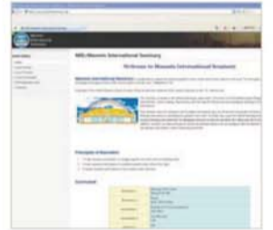
மான்மின் சர்வதேச கலாசாலை (MIS)யின் இணையதளம்

MISன் தலைமையகம் சீயோலில் உள்ளது. அதன் கல்வி கூடங்கள், பெல்லியம், அமெரிக்க ஐக்கியம், ரஷ்யா, இந்தியா, சீனா, தைவான், ஐக்கிய ராஜ்ஜியம், பெரு போன்ற இடங்களில் உள்ளன. மாணவர்கள் இணைய தளத்தில் உள்ள பிரசங்கங்களையும் கேட்கலாம். நீங்கள் MIS இணையதளத்தை www.manminseminary.org க்குள் சென்று, அங்கத்தினராக பதிவு செய்து, படிவத்தை பூர்த்தி செய்யவும், பின் விண்ணப்படிவும் முடிவ