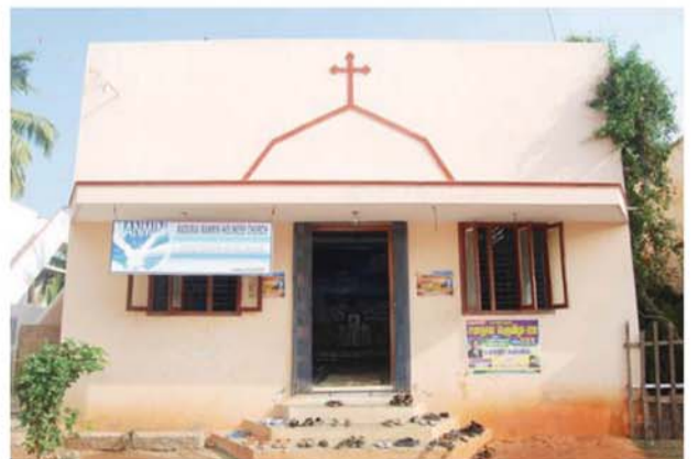
மதுரை மான்மின் பரிசுத்த ஆலயம்