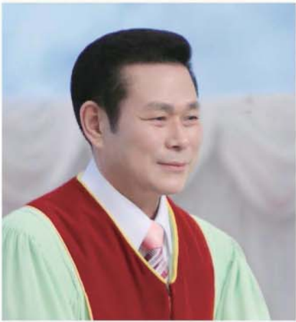
தலைமை போதகர் அறிவர். ஜேராக் வீ

“சமாதானத்தின் தேவன் தாமே உங்களை முற்றிலும் ஈரத்தமாக்குவாராக. உங்கள் ஆவி ஆத்துமா சரீரம் முழுவதும், நம்முடைய கந்திராகிய இயேசு கிறிஸ்து வரும்போது குற்றமற்றதாயிருக்கும்படி காக்கப்படுவதாக” (1தெசலோனிக்கேயர் 5:23).