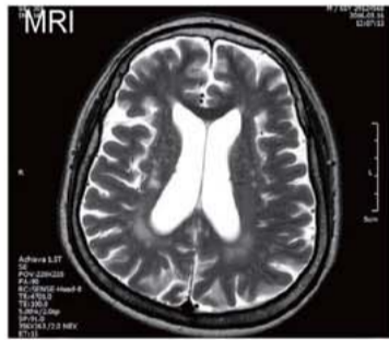
வயோதிபம் தவிர, பெருமூளை நசிவுறலின் எந்த ஒரு அடையாளமும் இல்லை