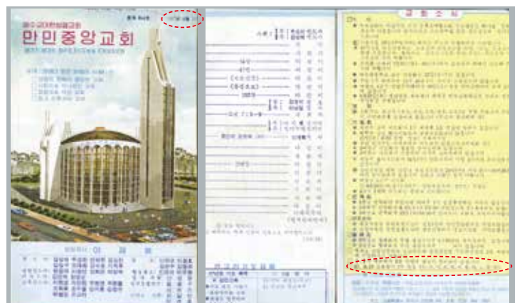
「629」預言刊登在1987年6月21日萬民中央教會週報封面和扉頁

李載祿牧師之所以如此不斷預言，目的就是向全世界眾多靈魂見證永生的真神，給眾聖徒們栽種信心，建立德行，復興教會，擴張神國。