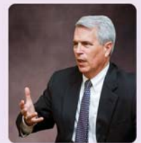
Доктор Френк Райт (президент спілки Національних релігійних дикторів)

«Телебачення ВХМ мріє передати любов Ісуса Христа, пристрасно розповсюджуючи Євангеліє. Я вірю, що воно чудово виконає цю роботу. За допомогою телебачення ВХМ багато людей дізнається про Ісуса Христа і отримує істинне життя, повіривши в Його ім'я».