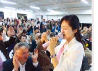
Фото 1, 2: Об'єднана кампанія доктора Джерок Лі у Гондурасі 2002 року, розпалення вогню служіння в Латинській Америці, Фото 3: З президентом Перу у президентському палаці, Фото 4, 5: Об'єднана кампанія доктора Джерок Лі в Перу, Фото 6-10: люди зіцпилися від багатьох хвороб, Фото 11-13: Збори зіцлення з хусткою преподобної Хісан Лі у Перу і Колумбії у квітні 2014 року

Центральна Церква Манмін налічує близько 10 000 церков-філій і товариських церков по всьому світу. Також церква активно виконує своє служіння у Латинській Америці через радіомовлення і хустку сили.