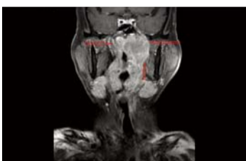
До молитви: назофарингеальний рак розміром 5.5 сантиметрів перекриває сонну артерію, виштовхуючи її до центру