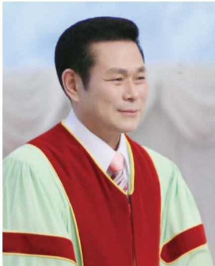
Старший пастор доктор Джерок Лі

Якщо ми назвемо людину злодієм, їй буде дуже незручно. Тому що всі ми добре знаємо, що красти – це гріх і злочин.