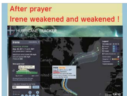
Ураган Ірина слабшає після молитви доктора Лі

► У вересні 2001 року Закордонна кампанія доктора Джерок Лі на Філіппінах мала відбутися у Лунета Парку. Перед кампанією два тайфуни мали прийти у той район, де мав відбутися захід. На прес-конференції доктор Лі відкрито заявив про свою віру, промовивши, що він довіряє Богові, Який привів його на Філіппіни, і що кампанія успішно відбудеться без жодних проблем. Насправді, саме так, як він говорив, кампанія була успішною, погода була прохолодною, без дощу.