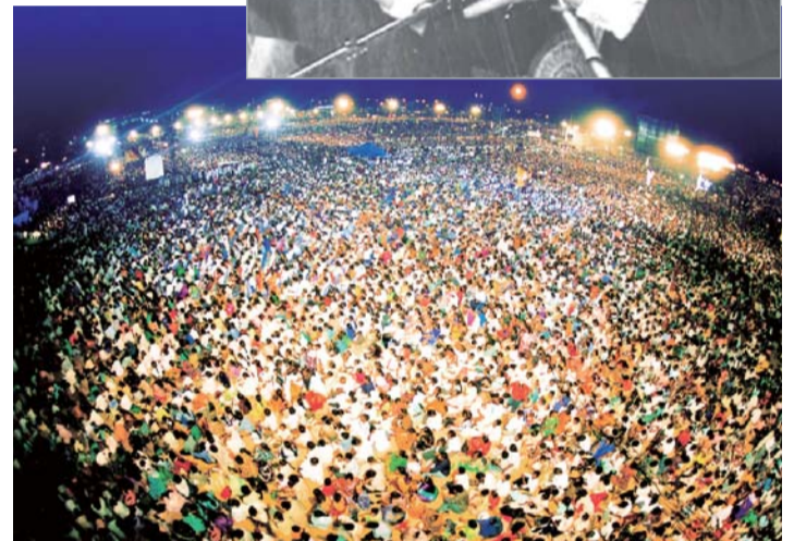
Об'єднану кампанію в Індії – 2002 відвідало загалом більше трьох мільйонів людей. Під час кампанії сувора засуха зменшилася. Багато людей зцілилося і повернулося до християнства.