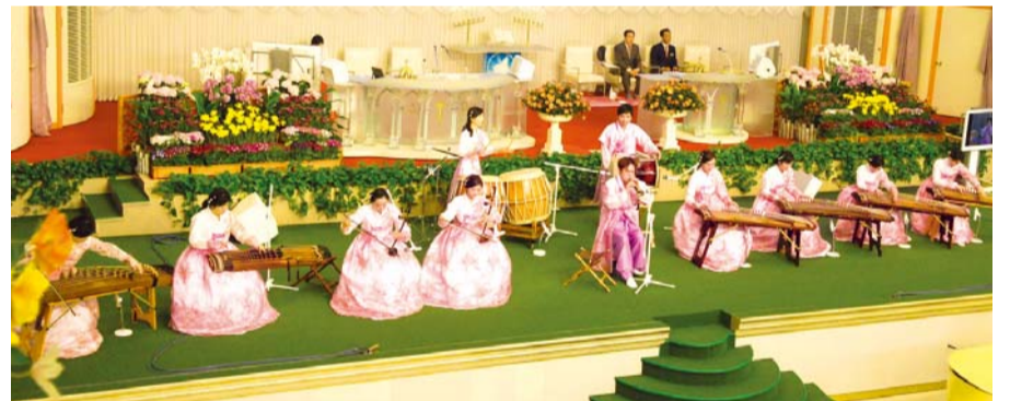
Команда корейської традиційної народної музики показує особливу виставу

Я дякую Богові, Який дав мені це велике благословення, а також спас мене, коли я був на шляху смерті, і дав мені надію на Новий Єрусалим. Алілуя!