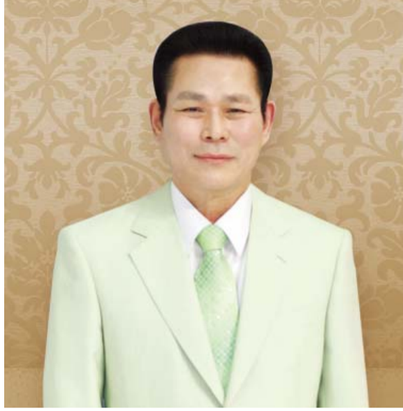
بزرگ پاسٹر ڈاکٹر بے راک لی

مسیح میں عزیز بھائی اور بہنو، میں خداوند کے نام میں دعا کرتا ہوں کہ پاک روح کی طرف سے آپ کی روح جنم لے اور آپ پوری طرح سے خداوند کے ساتھ ایک ہو جائیں تاکہ آپ اس دنیا میں بابرکت زندگی گزاریں اور نئے یروشلیم میں بھی، جو کہ آسمان پر سب سے زیادہ جلالی سکونت گاہ ہے۔