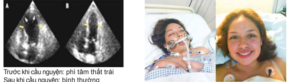
Trước khi cầu nguyện: phì tâm thất trái Sau khi cầu nguyện: bình thường