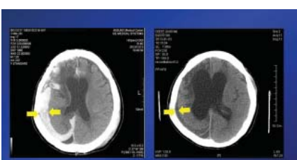
Trước khi cầu nguyện: Xuất huyết não ở bên phải Sau khi cầu nguyện: Không có xuất huyết não

Người nhà của anh nhận ra rằng họ và anh đã có những bức tường tội lỗi chống nghịch Đức Chúa Trời và hết lòng ăn năn về tội lỗi quá khứ của mình trước mặt Chúa. Sau đó, họ nhận được lời cầu nguyện của tiên sĩ Lee một lần nữa và sự cầu nguyện vượt không gian và thời gian ấy đã chữa lành anh khỏi viêm phổi và xuất huyết não.