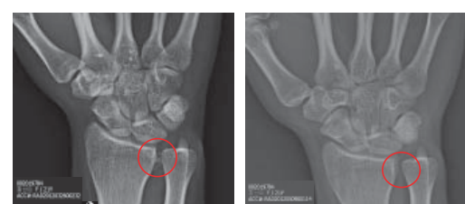
Trước khi cầu nguyện: Vôi hóa Sau khi cầu nguyện: Không có vôi hóa