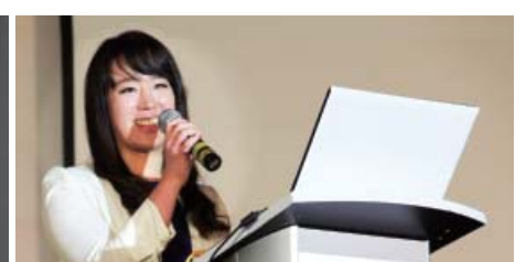
Cô đã chứng minh cho trường hợp chữa lành của mình trong Hội nghị Bác Sĩ Cơ Đốc Quốc Tế lần thứ 10 tại Mexico