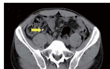
Sau khi cầu nguyện, ruột thừa bình thường