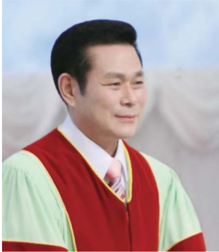
Mục sư Tiến sĩ Jaerock Lee

“Và, bông trái của điều công bình thì gieo trong sự hòa bình, cho những kẻ nào làm sự hòa bình vậy” (Gia-cơ 3:18).