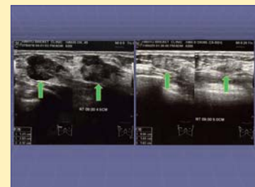
Chẩn đoán bằng siêu âm – khối u 2,17cm đã biến mất.