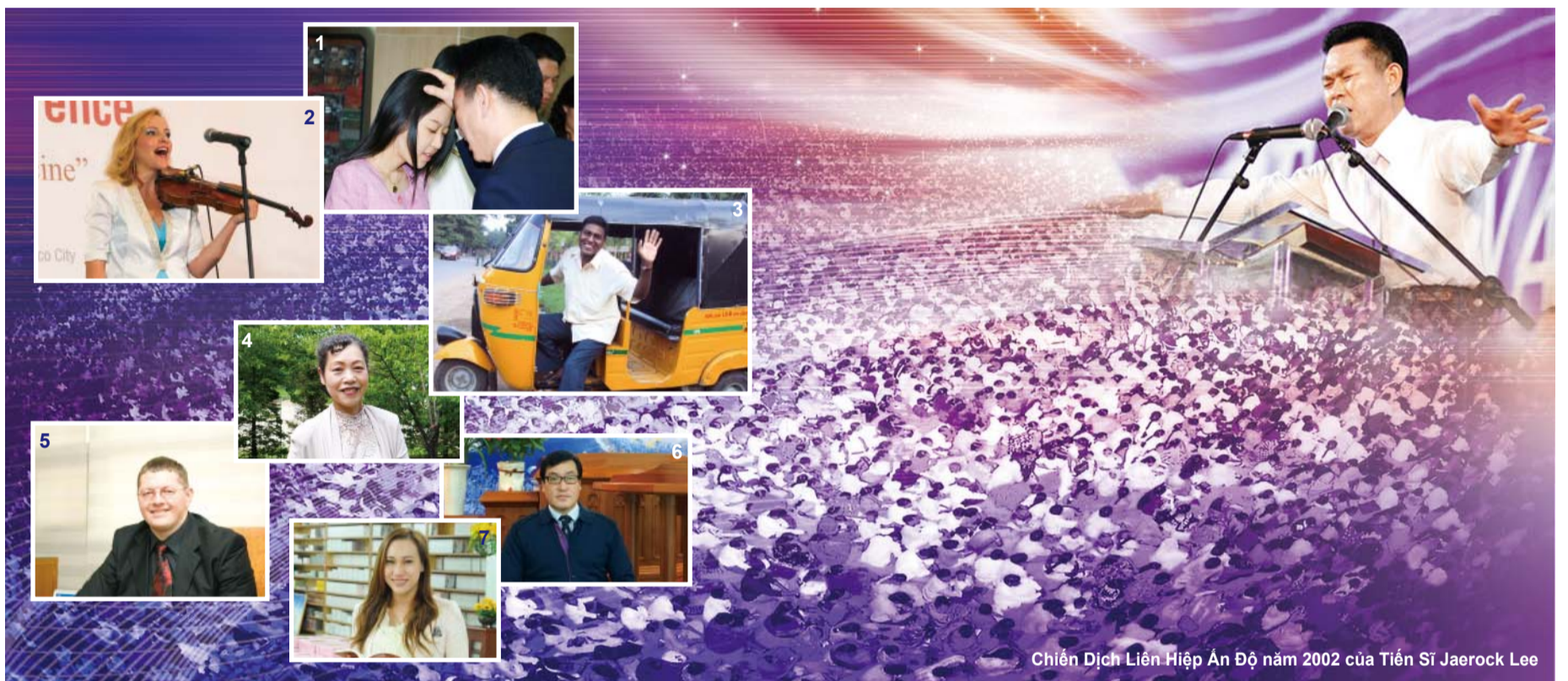
Chiến Dịch Liên Hiệp Ấn Độ năm 2002 của Tiến Sĩ Jaerock Lee

“Xuất hiện nhiều lưới rời rạc như lưới bằng lửa, đáp đậu lên mỗi người trong họ”